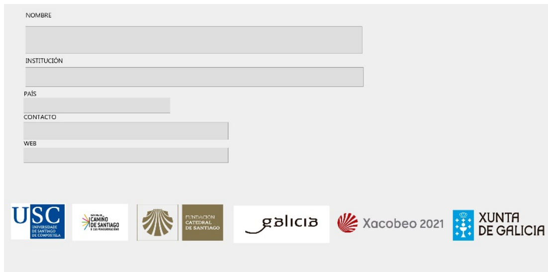
Ejemplo de interfaz de la tabla de instituciones de la Base Red Jacobea